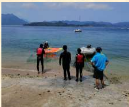
學員正在享受滑浪風帆的樂趣