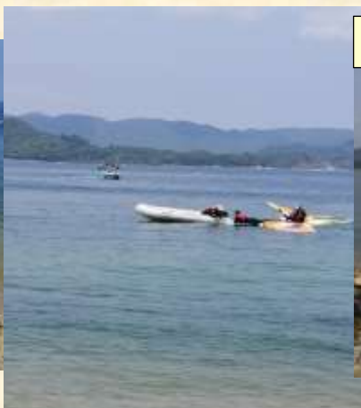
教練在快艇上準備考核學員技術