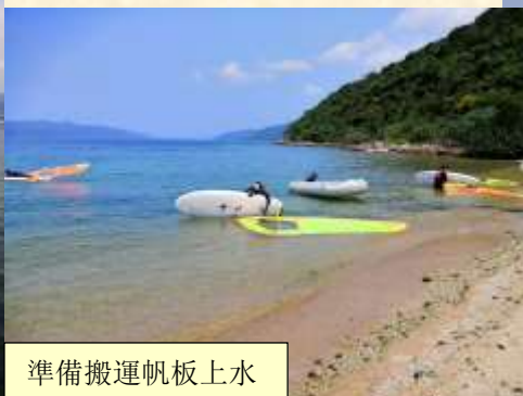
準備搬運帆板上水