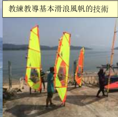
教練教導基本滑浪風帆的技術