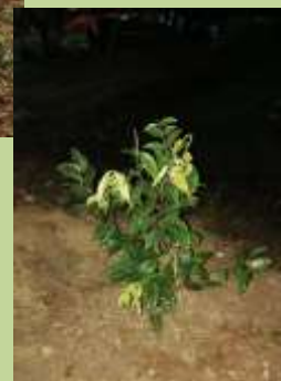
培哥剛種的 "嘉寶果樹" 成長後果實纍纍，供會友享用