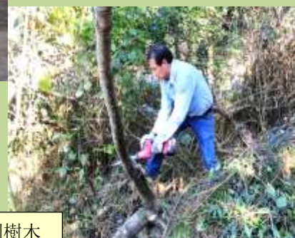
培哥清理被風吹倒樹木